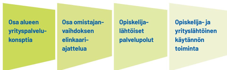
KUVIO 1. Toimivan Jatkajakoulun ominaisuuksia

Selvityksen tarkoituksena oli myös nostaa keskusteluun oppilaitosten ja korkeakoulujen yhteydessä toimivien Jatkajakoulujen toiminnan edellytyksiä. Selvityksen perusteella muotoiltiin toimivan Jatkajakoulun ominaisuuksia.